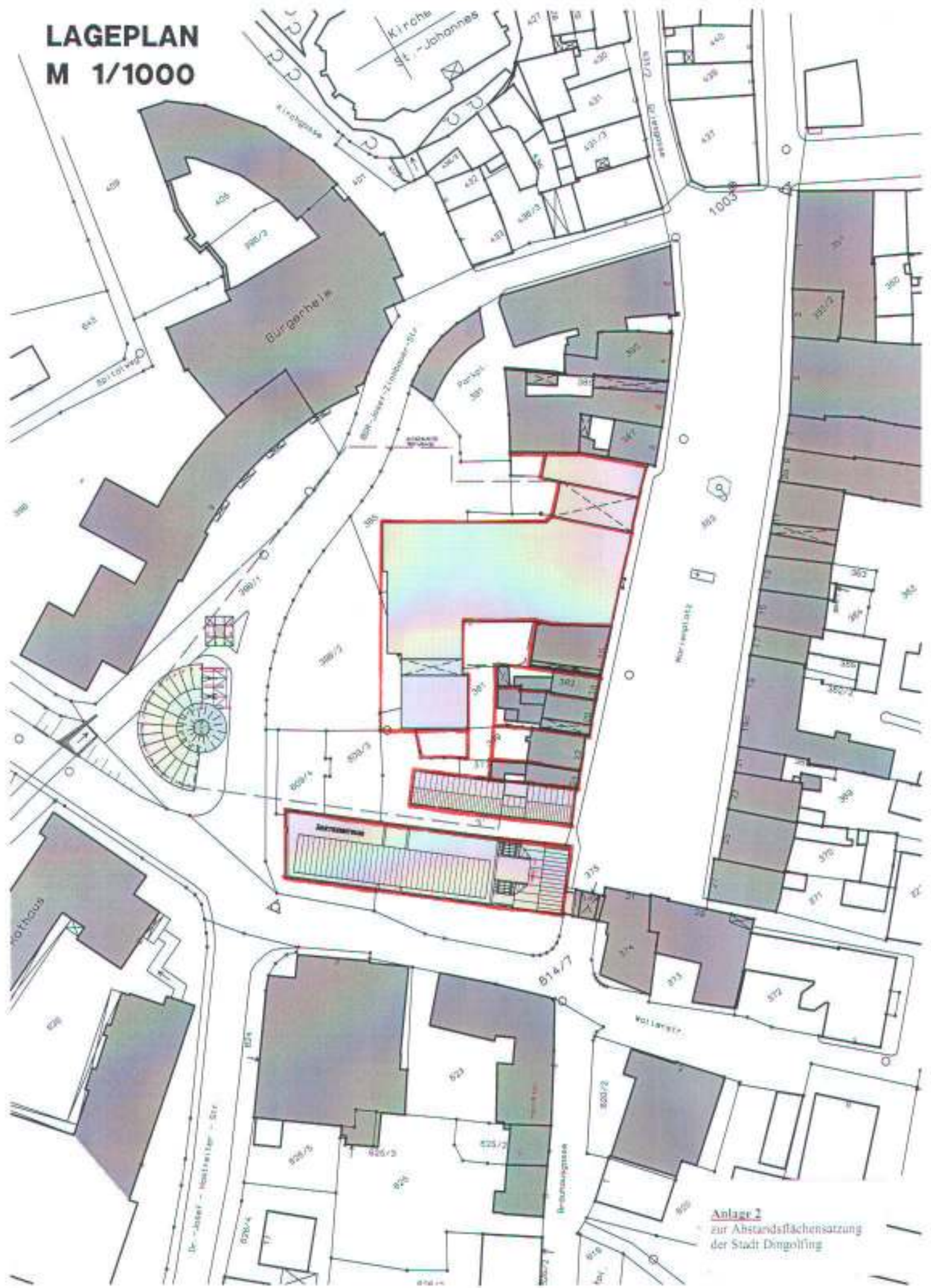
Anlage 2 zur Abstandsflächensatzung der Stadt Dingolfing